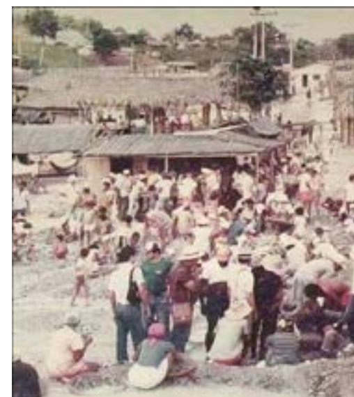
Garimpo de Esmeraldas, Campos Verdes