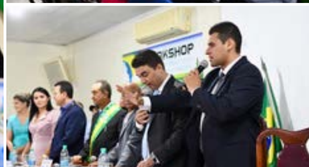
Novo prefeito e novo presidente da Câmara de Vereadores de Santa Terezinha de Goiás assumem mandatos em concorrida sessão extraordinária. Pág. 7